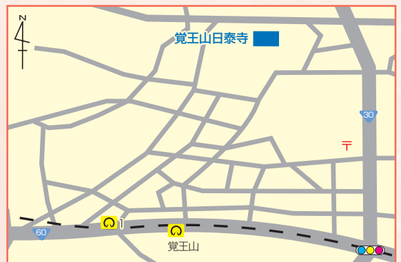
○名古屋大学地下鉄 東山線「覚王山」駅下車 1番出口から徒歩約10分 ※会場には駐車場がありませんので公共交通機関でお越しください