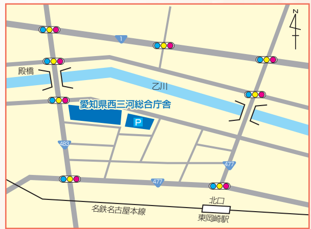
○名鉄名古屋本線「東岡崎」駅下車 北口から徒歩約5分