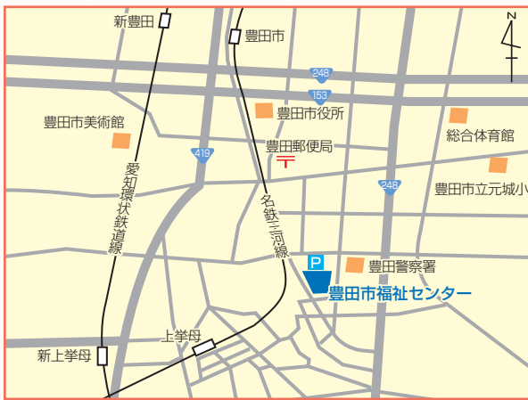
○名鉄三河線「豊田市」駅から徒歩約30分、「上挙母」駅から徒歩約10分 ○愛知環状鉄道「新豊田」駅から徒歩約35分、「新上挙母」駅から徒歩約15分