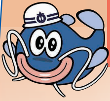
あいち防災キャラクター 防災ナマズン