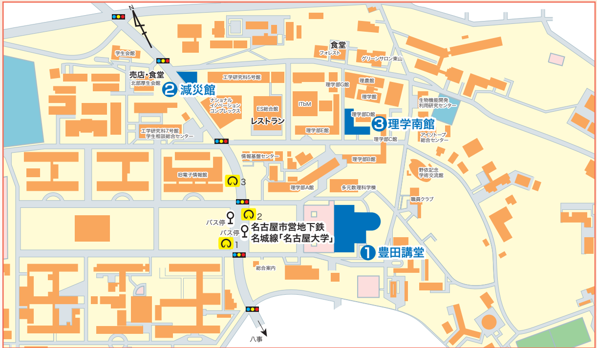
○名古屋大学地下鉄 名城線「名古屋大学」駅下車 2番出口から徒歩約5~10分 ※会場には駐車場がありませんので公共交通機関でお越しください